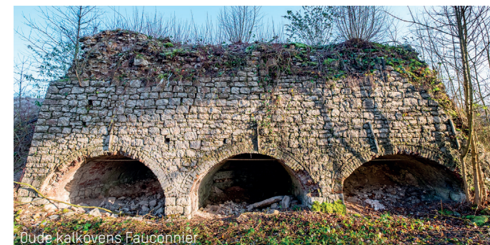
Dude kalkovens Fauconnier

20 Verderop ziet u een grote, steile rotspartij. De hoge kalkstenen rotsen bevinden zich in een bijna verticale positie, wat aangeeft met hoeveel kracht, tijdens het Carboon circa 350 miljoen jaar geleden, de lagen kalksteen werden opgetild en afgezet op de bodem van de toen nog tropische zee! Aan de voet van de steile rotsen, tussen de stenen leeft een andere voor het natuurgebied kenmerkende diersoort, de kettingpad (of vroedmeesterpad) die in zomernachten zijn bijzondere fluitzang laat horen. Vervolg uw weg rechts over het talud om terug te keren naar de treden onder de R3.