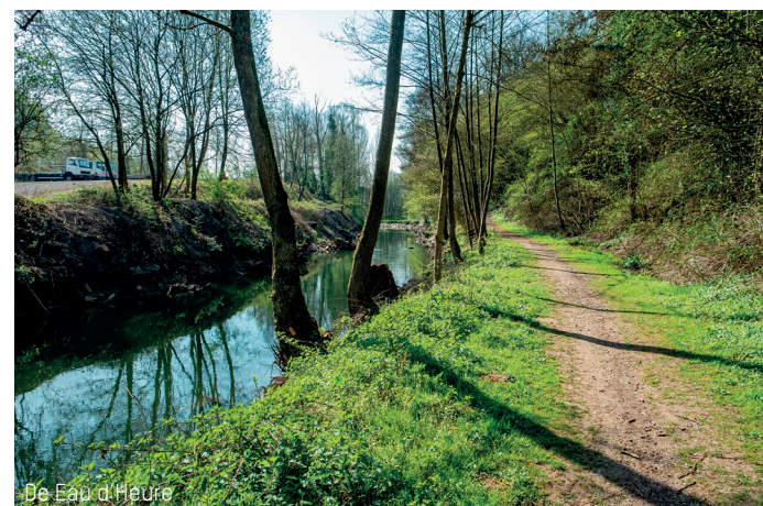
De Eau d'Heure

De naam zou afstammen van het pre-Keltische woord 'aar', dat 'stromend water' betekent en dat later veranderde in 'Eure'. Echter, volgens J.-J. Jaspers, zou de naam afstammen van het Keltische woord 'idhara', wat 'heldere waterloop' betekent en dat later veranderde in 'Heure'. De volkslegendes willen dan weer dat de Eau d'Heure zijn naam dankt aan het feit dat de rivier in één uur (heure) tijd buiten zijn oevers kan treden.