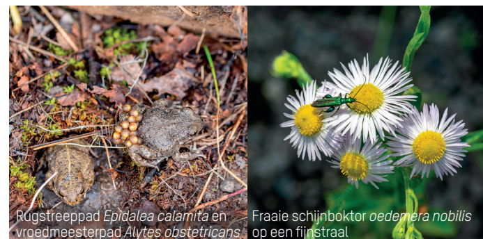
Rugstreeppad Epidalea calamita en vroedmeesterpad Alytes obstetricans

11 Na ongeveer 250 meter neemt u het dalende pad richting huisnummer 4. Dit is het huis waarin Jacques Germain woonde, de landeigenaar waaraan de straat zijn naam dankt. Iets verder aan de rechterkant ontwaart u de resten van een voormalige openbare waterput. Het pad blijft dalen en aan de linkerkant ziet u een oud huis met de naam 'Les Cailloutis' en de inscriptie 1743.