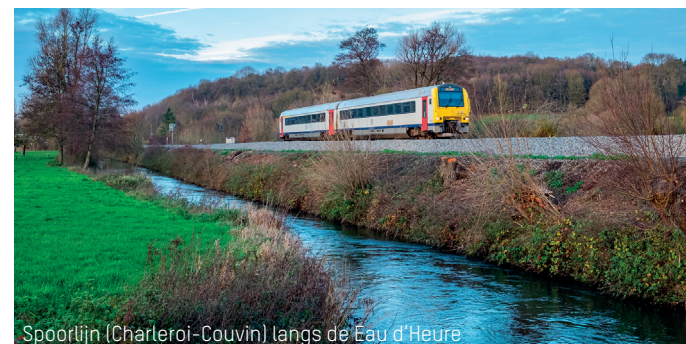
Spoorlijn (Charleroi-Couvin) langs de Eau d'Heure

15 Het pad komt uit op een plein. Recht voor u, rechts van de spoorwegovergang, bevond zich het station Montigny-le-tilleul, dat in 1983 werd gesloopt. Aan de andere kant van de spoorlijn ziet u een fabriek waar vroeger tegels van kalkzandsteen werden gemaakt. Het pand huisvest nu meerdere kleine ondernemingen. De waterpomp van het waterbedrijf SWDE, rechts van u, pompt het water direct in het ondergronds waterbekken (en niet in de ondergelopen afgraving erachter, dit is eveneens privébezit). U bent terug op het startpunt onder de viaduct.