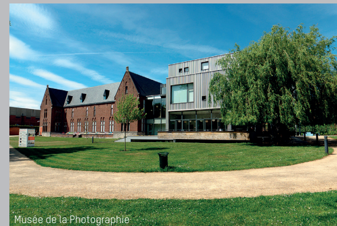
Musée de la Photographie

Av. P. Pastur, 11- 6032 Mont-sur-Marchienne Tél. +32 (0)71 43 58 10 - www.museephoto.be