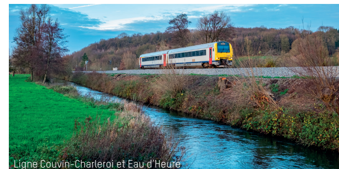
Ligne Couvin-Charleroi et Eau d'Heure

15 Le chemin débouche sur une esplanade. Droit devant vous, à droite du passage à niveau se trouvait la gare de Montigny-le-Tilleul, rasée en 1983. De l'autre côté des voies se dresse une ancienne usine qui produisait des carrelages de calcaires agglomérés. Elle abrite maintenant plusieurs petites entreprises. A droite, un captage de la SWDE pompe l'eau directement dans la nappe phréatique (et pas dans la carrière inondée à l'arrière, également propriété privée). Retour au point de départ, sous le viaduc.