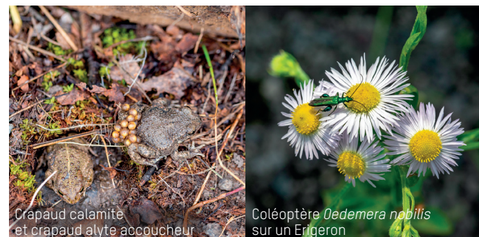
Crapaud calamite et crapaud alyte accoucheur