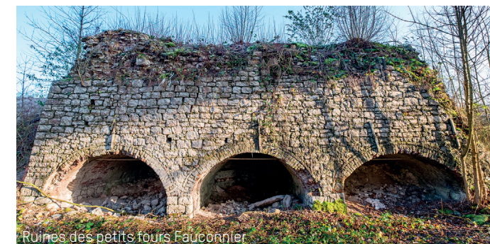
Ruines des petits fours Fauconnier

20 Arrêtez-vous un peu plus loin devant un large pan de falaise bien dégagé. Vous observez de hauts bancs calcaires presque verticaux. Imaginez la puissance du plissement hercynien qui a dressé ces couches de roches calcaires, déposées au fond de la mer tropicale du Carbonifère qui occupait le territoire il y a plus de 350 millions d'années ! Certaines nuits d'été, on peut entendre, dans les éboulis au pied des abrupts, le chant flûté des crapauds alytes (ou accoucheurs), autre espèce emblématique de la réserve. Suivez le balisage et longez le talus vers la droite pour retrouver l'escalier sous le R3.